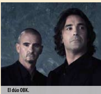
El dúo OBK.

Lugar: Sala Vivero. Fecha: 27 de noviembre. Hora: 23:00 horas. Entradas: Por determinar. Información: www.salavivero.com.