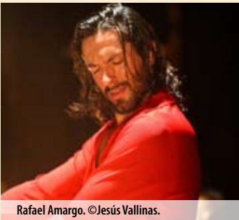
Rafael Amargo.

Lugar: Teatro Alameda. Fecha: Del 20 al 23 de noviembre. Hora: 21:00 horas (días 20 y 21), 19:00 y 22:00 horas (día 22), 19:30 horas (día 23). Entradas: Entre 25 y 30 euros. Información: 952 213 412.