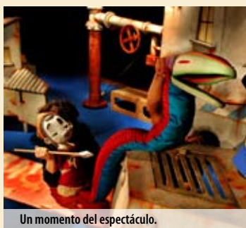
Un momento del espectáculo.

LA CIUDAD INVENTADA, DE LA COMPAÑÍA TEATRO GORAKADA