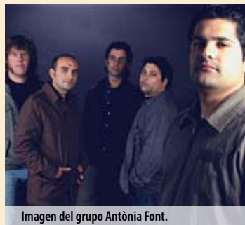
Imagen del grupo Antonia Font.

Lugar: Sala Vivero. Fecha: 22 de noviembre. Hora: 23:00 horas. Entrada: Entre 12 y 15 euros. Información: www.salavivero.com.