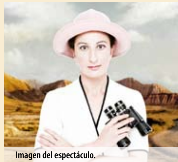
Imagen del espectáculo.

ARIZONA, DE LA COMPAÑÍA MUTIS PRODUCCIONES