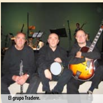
El grupo Tradere.

MÁLAGA RITUAL 2008 CONCIERTO DE TRADERE (ESPAÑA)