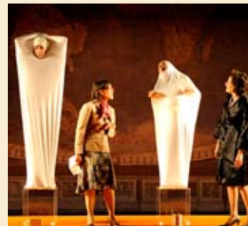
Un momento de la obra.

Lugar: Teatro Cervantes. Fecha: 27, 28 y 29 de noviembre. Hora: 20:30 horas. Entradas: Entre 9 y 24 euros. Información: 952 224 100.