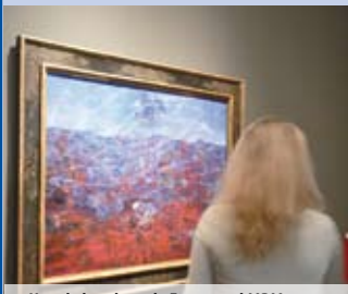
Una de las obras de Ernst en el MPM.

MÁS ALLÁ DE LA PINTURA. MAX ERNST EN LA COLECCIÓN WÜRTH