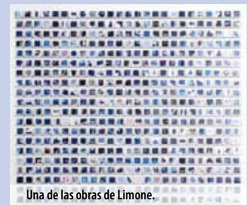
Una de las obras de Limone.

Lugar: Galería Gacma (C/ Fidiás, 48-50).