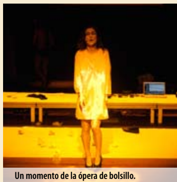
Un momento de la ópera de bolsillo.

LA BALADA DE RICKY & RONNY - UNA ÓPERA POP, DE MAISONDAHLBONNEMA / NEEDCOMPANY