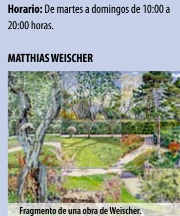
Fragmento de una obra de Weischer.