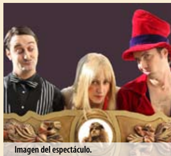
Imagen del espectáculo.

LA LOCA HISTORIA DE MCBETH, DE LA COMPAÑÍA TEATRO CRÓNICO