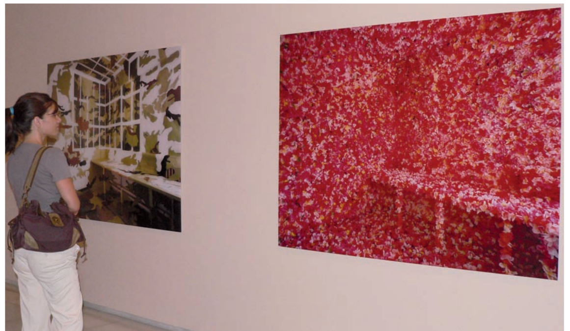
Imagen de un par de obras en una de las salas del Palacio Episcopal, que acoge la exposición del XI Certamen de Artes Plásticas de Unicaja.