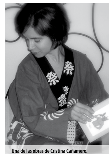
Una de las obras de Cristina Cañamero.

Jason Martin expuso en 2005 en el CAC Málaga, donde presentó su impresionante pieza Aquarius , un óleo sobre aluminio de grandes dimensiones que recordaba al espectador el continuo movimiento de un torrente de agua.