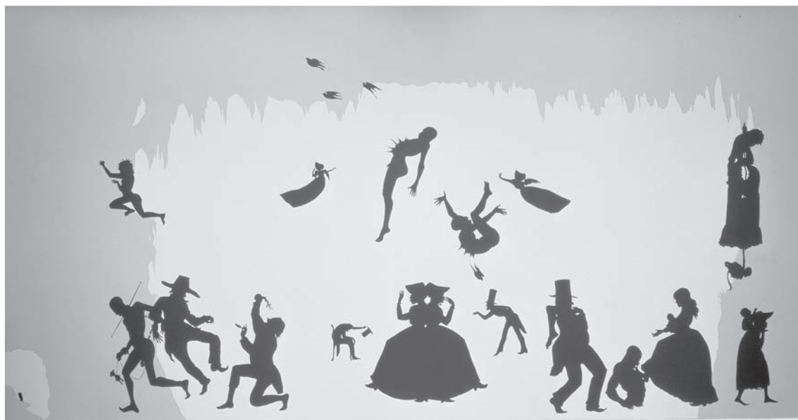
La obra The Long Hot Black Road to Freedom, double-dixie two-step , realizada con figuras de papel pegadas en la pared y pinturas.

La prestigiosa artista norteamericana presenta en exclusiva su instalación The Black Road , que muestra sus características siluetas recortadas