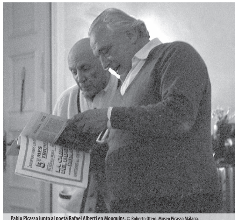
Pablo Picasso junto al poeta Rafael Alberti en Mougins.