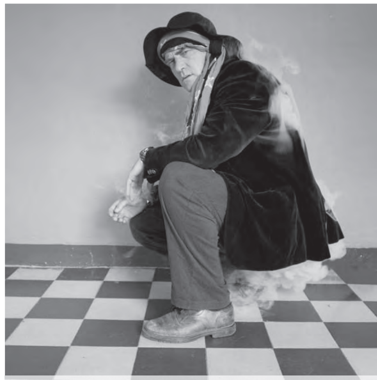
Fragmento de una de las videoocreaciones, Antonio Amores.