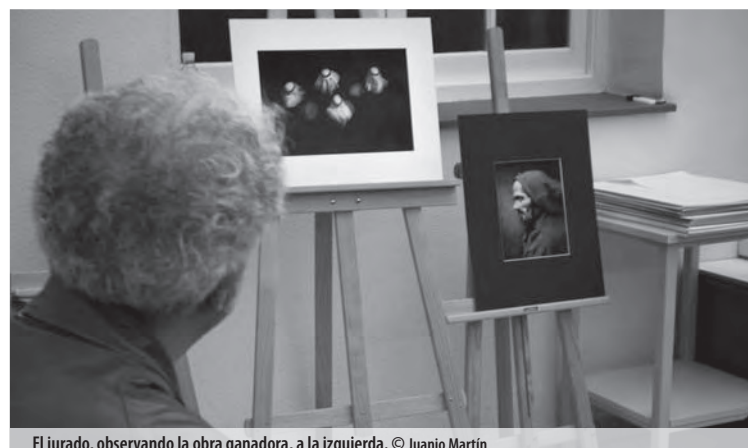
El jurado, observando la obra ganadora, a la izquierda.