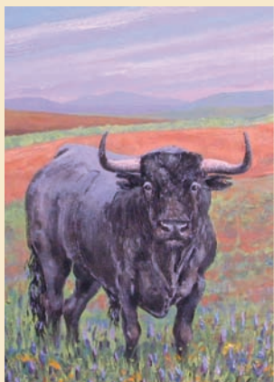
Una de las pinturas de Vázquez Mancera.