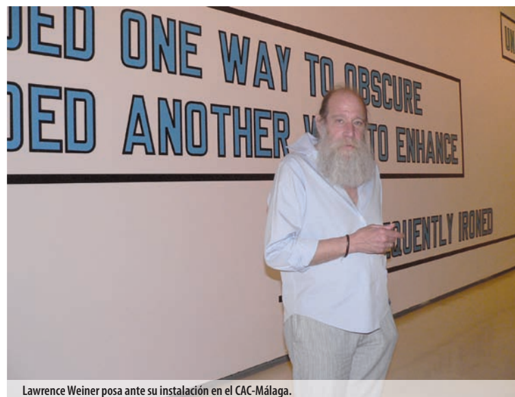
Lawrence Weiner posa ante su instalación en el CAC-Málaga.

Lawrence Weiner toma el lenguaje como materia escultórica con la que crear sus obras, técnica que emplea para componer esta exposición. Weiner cree que la construcción lingüística puede provocar la misma reacción en el espectador que un objeto escultórico conven-