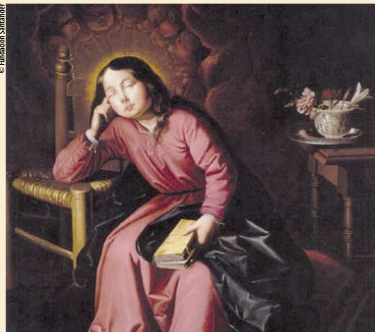
Fragmento de la obra de Zurbarán Virgen niña dormida, que se exhibe en la muestra.

El Rectorado de la UMA exhibe una selección de obras del Santander, con piezas de Zurbarán, Sorolla o Romero de Torres, entre otros