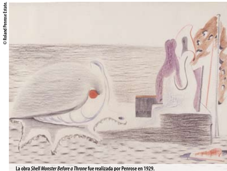
La obra Shell Monster Before a Throne fue realizada por Penrose en 1929.

La Fundación Picasso-Casa Natal apuesta por profundizar en la obra de artistas contemporáneos y allegados a la figura de Picasso. Por ello, presenta la primera exposición en la ciudad del artista Roland Penrose (1900-1984), en la que se repasa la trayectoria de uno de los surrealistas británicos más importantes.