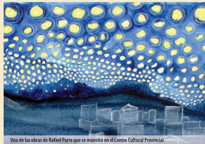
Una de las obras de Rafael Parra que se muestra en el Centro Cultural Provincial.