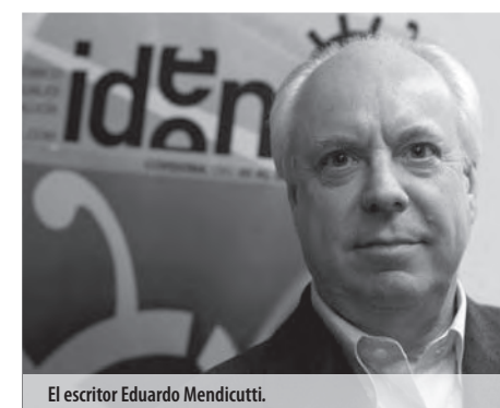
El escritor Eduardo Mendicutti.

Los problemas vienen cuando este hablador personaje decide solicitar que su calle sea la que hasta ahora se llamaba Silencio , en recuerdo, sorprendentemente de todo lo que ha tenido que callar. Sin embargo, esta petición le enfrenta a los devotos de la Cofradía del Silencio, que pasa por esta vía en Semana Santa y a la que debía su nombre la calle. Mendicutti traza un relato hábil, basado siempre en la reconstrucción que este personaje hace de