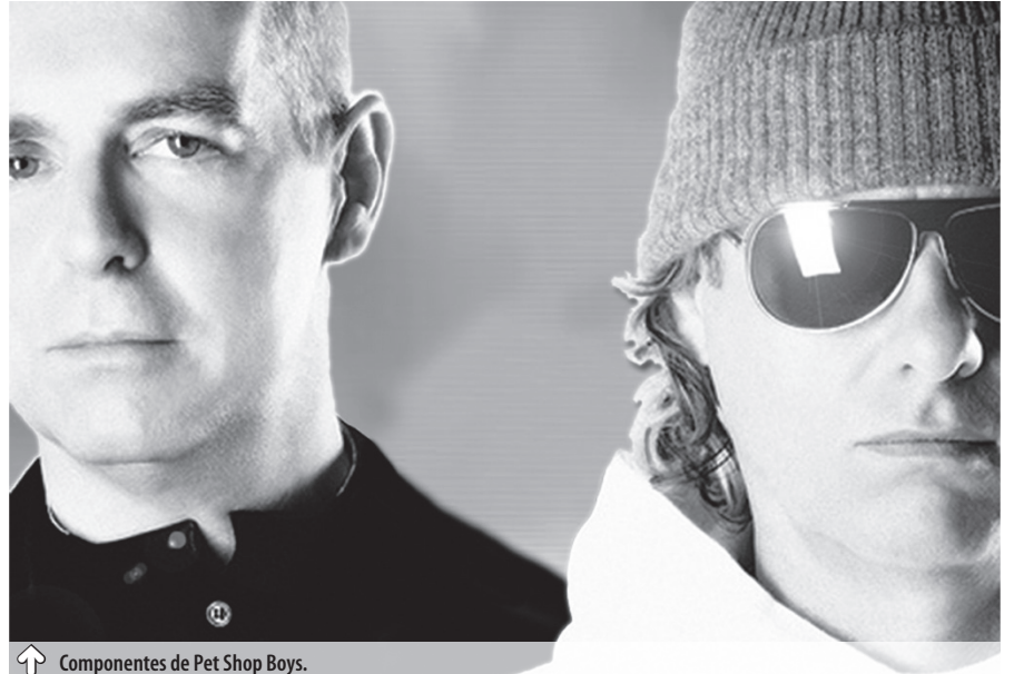
↑ Componentes de Pet Shop Boys.

Después de publicar un álbum de remezclas, los Pet Shop Boys publican su segundo álbum bajo el título de Actually . En 1988 publican su tercer álbum, titulado Introspective , que incluía temas tan importantes como Always on my mind , Left to my own devices , Domino dancing y It's alright . En 1990 aparece Behaviour , poco después publican su primer recopilatorio, titulado Discography . En 1993 aparece Very y en 1996 Nightlife . En el año 2002 editan Release . Este disco tiene un sonido menos electrónico y más melódico que en sus anteriores trabajos. En el 2003 aparece Popart: The hits , un nuevo álbum recopilatorio que recoge sus 33 top 20 logrados en Gran Bretaña, que han convertido a Pet Shop Boys en el dúo con mayor éxito de todos los tiempos.