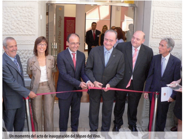
Un momento del acto de inauguración del Museo del Vino.

Este Museo se ha podido hacer realidad gracias a un acuerdo firmado en 1999 entre la Consejería de Turismo y Deportes de la Junta de Andalucía y el Ayuntamiento de Málaga, por el que ambas instituciones han colaborado en la restauración del edificio y la puesta en marcha del Museo, en un compromiso con la cultura del vino. Ambas instituciones destacan el impulso que esta nueva instalación supone para el turismo cultural.