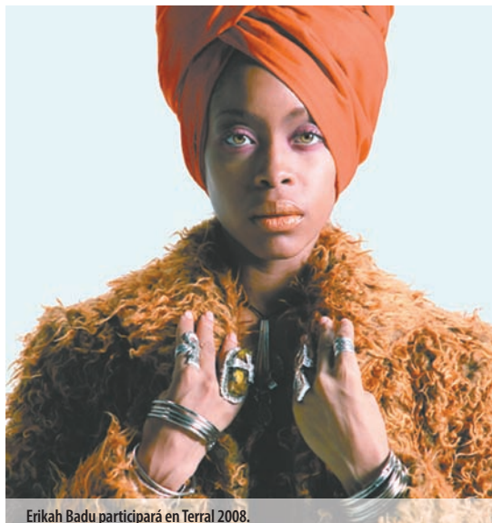
Eriqah Badu participará en Terral 2008.