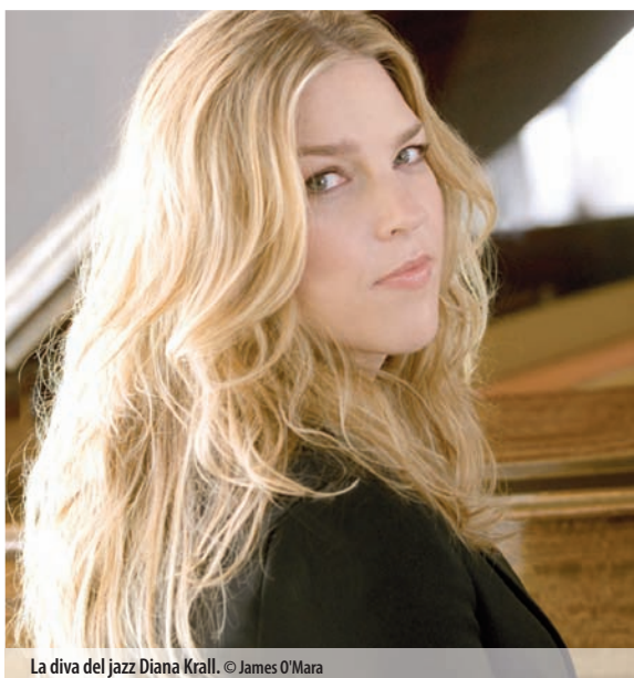
La diva del jazz Diana Krall.