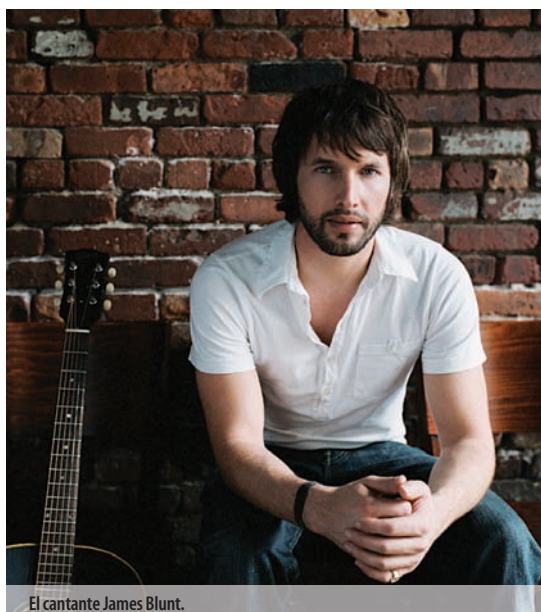
El cantante James Blunt.

Ya en julio, el día 6, el Terral cuenta con la presencia de una de las voces más populares del pop actual, el británico James Blunt, que presentará su disco All the souls lost , segundo trabajo discográfico de su carrera con el que este ex capitán del ejército británico continúa la senda abierta con su anterior disco Back to Bedlam , con el que saltó a la fama con sus melodías y letras llenas de fuerza y carisma en las que trata temas universales. Su