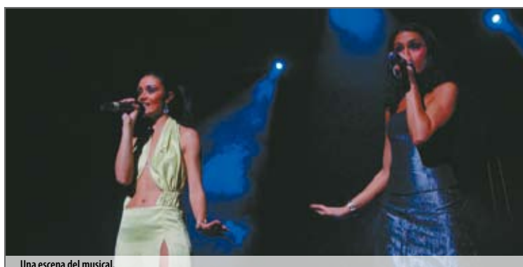
Una escena del musical.

La fuerza del baile y las excelentes coreografías de las que los jóvenes bailarines hacen gala en este espectáculo son el comple-