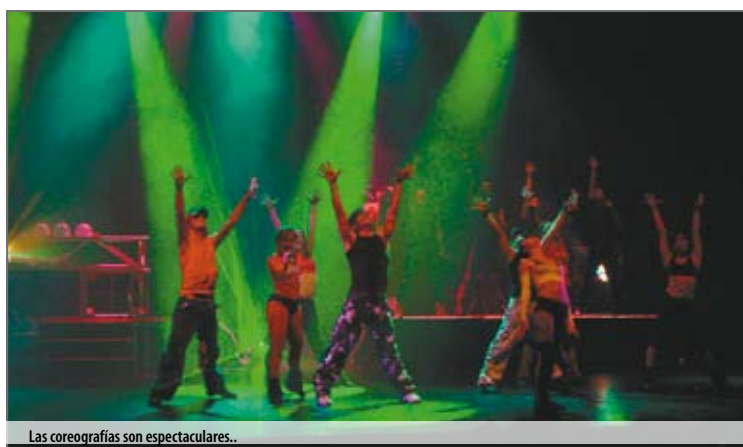
Las coreografías son espectaculares.

Temas tan emblemáticos y representativos de los años 80 como: Last Dance , Out here on my own , Hot staff o She workes hard for the money ... entre otros completan la banda sonora de este musical.