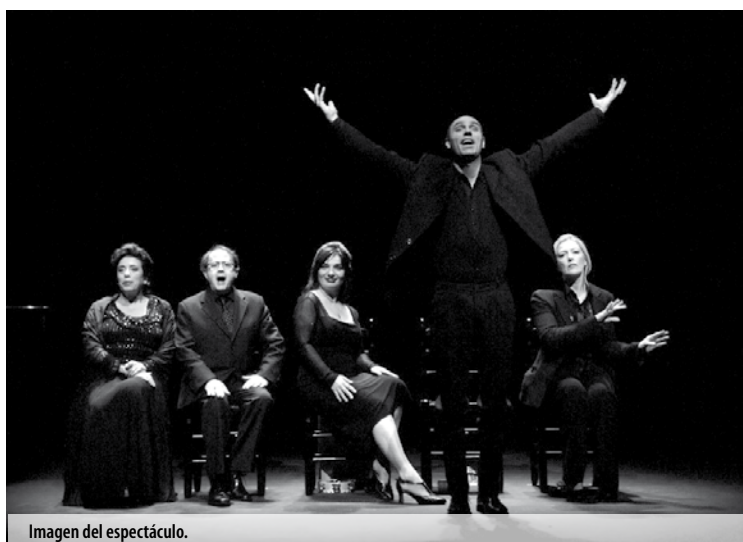
Imagen del espectáculo.

El montaje comienza situando al espectador en el año 1939, con una escena cargada de humor negro que da paso a un tono menos ácido a lo largo de la obra. El texto repasa la idiosincrasia de la España más profunda durante los años 40, 50 y 60. La obra es una producción de la Sala Mun-