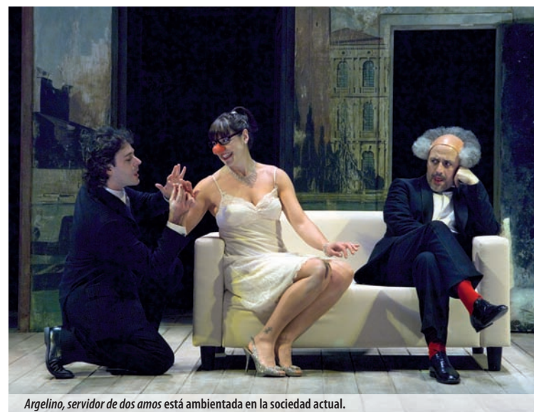
Argelino, servidor de dos amos está ambientada en la sociedad actual.

El proyecto parte del convencimiento de que hay que dialogar con las obras de los autores del pasado, explica San Juan, que destaca que la obra trata "de la difi-